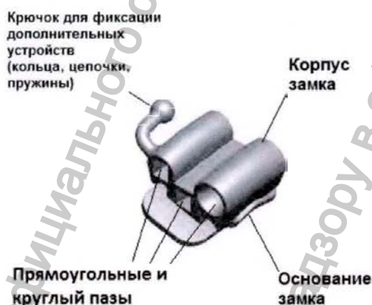
Рисунок 10 – Замок TBN

Замок TBN имеет тройной паз – два прямоугольных и один круглый, вход без расширения, крючок для установки дополнительных ортодонтических устройств.