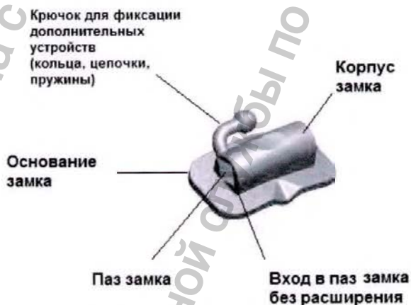
Рисунок 3 - Замок SBN 1G

Замок SBN 1G имеет одинарный прямоугольный паз, вход без расширения, крючок для установки дополнительных ортодонтических устройств.