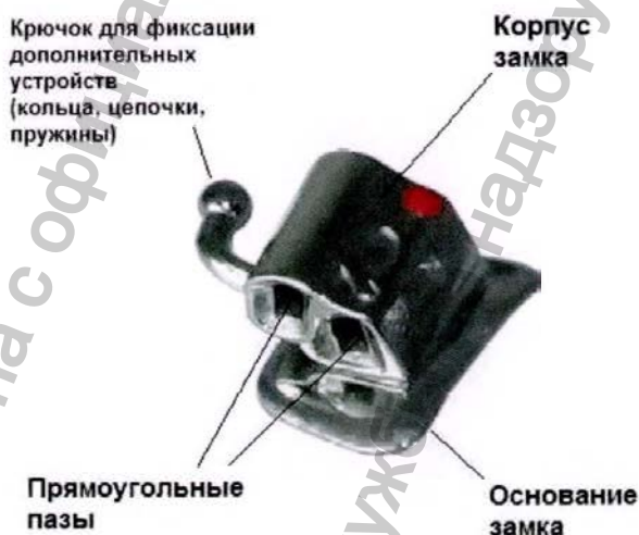
Рисунок 8 – Замок DRBN

Замок DRBN имеет двойной прямоугольный паз, вход без расширения, крючок для установки дополнительных ортодонтических устройств.