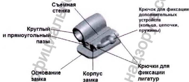
Рисунок 5 - Замок DCBC

Замок DCBC имеет двойной круглый и прямоугольный паз, съёмную стенку, крючки для фиксации лигатур, вход без расширения, крючок для установки дополнительных ортодонтических устройств.