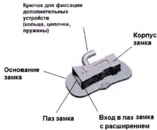
Рисунок 4 - Замок SBN 4G