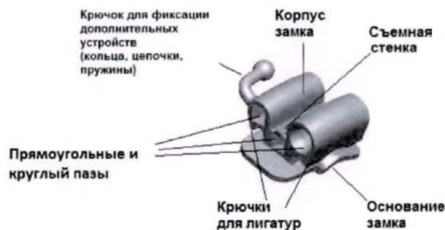
Рисунок 9 – Замок TBC