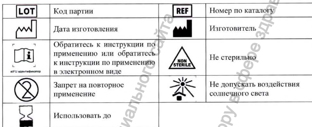
Таблица 3 – Обозначения и символы