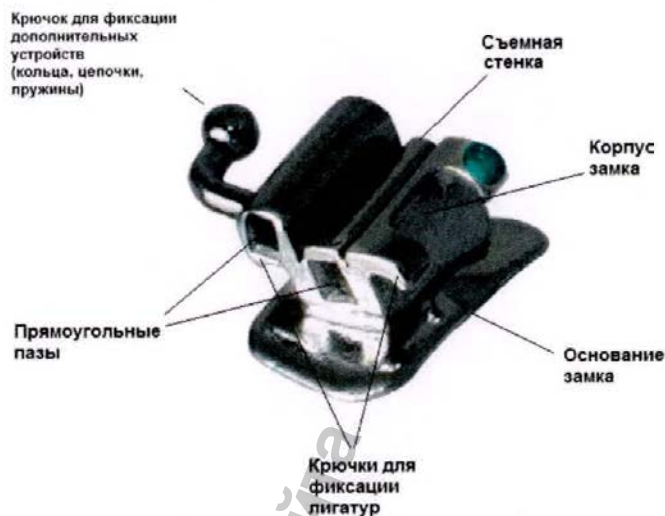
Рисунок 7 – Замок DRBC