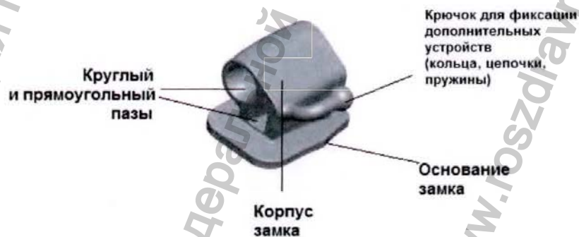
Рисунок 6 - Замок DCBN

Замок DCBN имеет двойной круглый и прямоугольный паз, вход без расширения, крючок для установки дополнительных ортодонтических устройств.