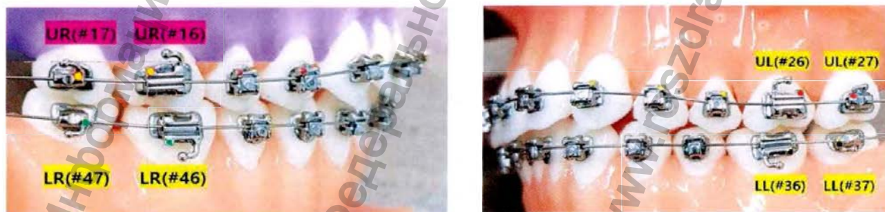
Рисунок 1 - Расположение замков на зубах

Брекеты имеют цветную навигационную маркировку, которая помогает определить номер зуба, для которого предназначено данное изделие. Маркировка выполнена в виде отметок чернилами на корпусе замка (см. Таблица 1). Замки имеют лазерную маркировку, нанесенную на основание.