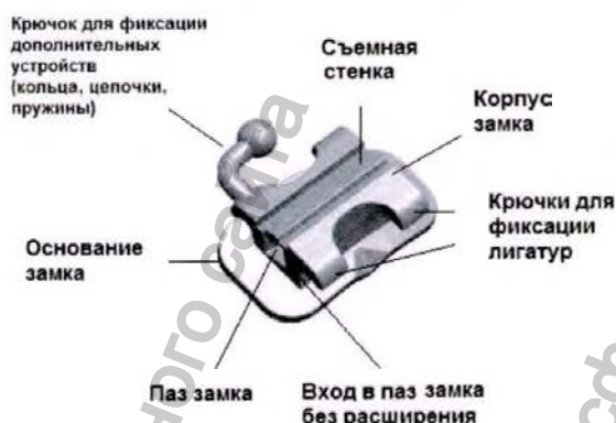
Рисунок 2 - Замок SBC 1G

Замок SBC 1G имеет одинарный прямоугольный паз, съёмную стенку, крючки для фиксации лигатур, вход без расширения, крючок для установки дополнительных ортодонтических устройств.